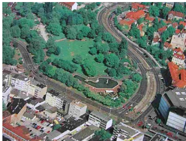
Centralpark Braunschweig: Naherholungsgebiet und Grüne Lunge

Es wird von zahlreichen Schlossbefürwortern argumentiert, dass unsere Stadt ein Stück Geschichte zurückbekommen könnte. Braunschweig sei eines Schlosses einfach würdig, wird gesagt. In wie fern es allerdings eines Schlosses würdig ist, darin Unterhosen und Socken zu verkaufen, erscheint uns erklärungsbedürftig. Trotz zahlreicher anders lautender Beteuerungen, ist von der Firma ECE direkt zu erfahren, dass im Schloss zwei Etagen für den Einzelhandel vorgesehen sind. Diese Tatsache ist eines Schlosses unwürdig. Ein „Potjomkinsches Dorf“ bringt keine Wiedergutmachung für den Abriss des Schlosses.