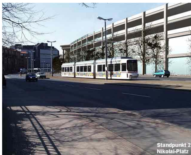
Beton statt Bäume: Eine 20 Meter hohe Mauer entsteht. Grafik: Jörg Tarrach

Wie oben beschrieben, wäre ein Kaufkraftabfluss in einem nicht zu verantwortendem Maße in beiden Fällen die Folge.