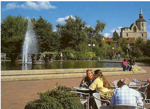
Ruhe und Entspannung nach dem Einkaufsbummel in der Innenstadt

Man rechnet mit Einnahmen in Höhe von 36 Mio. EUR. Mit diesem Geld muss die Schlossfassade aufgebaut werden (13,5 Mio. EUR). Des Weiteren wird inzwischen lediglich von einer Gestaltung der westlichen Seite des Bohlwegs gesprochen. Bisher war davon die Rede, dass dieser einen Boulevard-Charakter erhalten sollte. Die Umgestaltung der Georg-Eckert-Straße ist inzwischen nicht mehr vorgesehen. In der Entwicklungsvereinbarung vom 11.09.2002 strebte man eine „...optimale Anbindung an die vorhandenen innerstädtischen Einkaufslagen an“. Dieses Vorhaben hat sich auf den Hortentunnel – oder für Neubraunschweiger Galeria-Tunnel – reduziert.